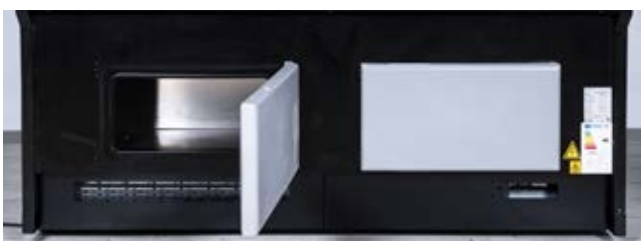
> Portillons de réserve

TARIF 2024 - AVRIL 2024 Prix publics HT en € Franco France Métropolitaine. Forfait 100 € pour tout achat inférieur à 1200 € net HT.