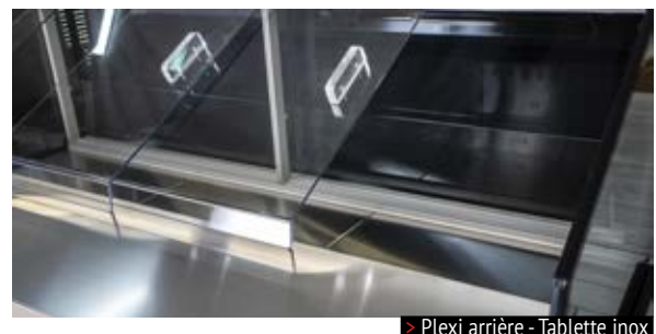
> Plexi arrière - Tablette inox