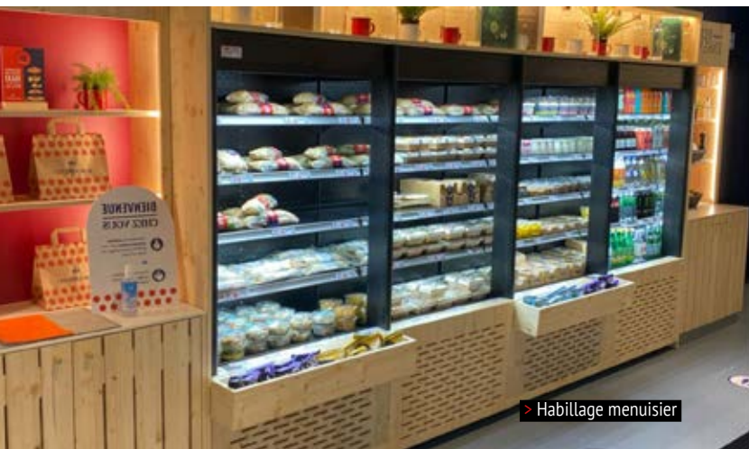
> Habillage menuisier