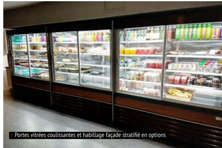
> Portes vitrées coulissantes et habillage façade stratifié en options