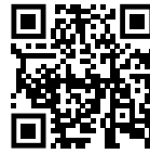
ALASKA ENERGY Vidéo Présentation

LONGUEURS POSSIBLES : 710, 960, 1250, 1510, 1856, 2435, 2955 et 3647 mm 2 PROFONDEURS : 635 et 790 mm