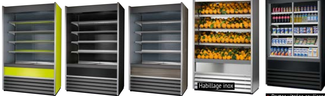
> Portes vitrées coulissantes en option