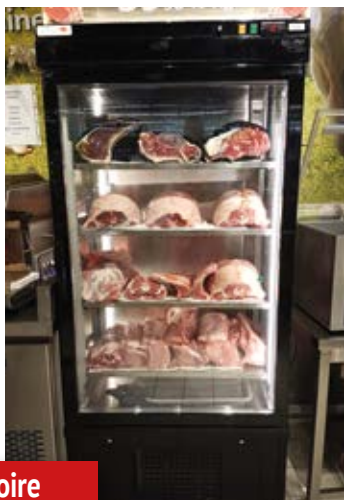
Armoire de maturation

Gamme spéciale maturation/affinage Régulateur spécifique permettant de varier le taux d'humidité intérieur de 25 à 75 % Intérieur inox - éclairage LED rosé (barre à pendre en option) Lampe UV bactéricide interrupteur vitesse de ventilation haute ou basse Evaporateur traité cataphorèse