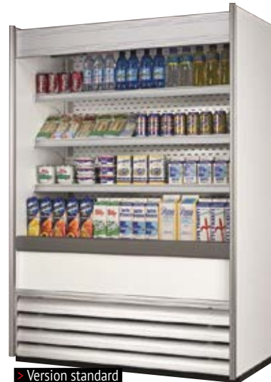
> Version standard