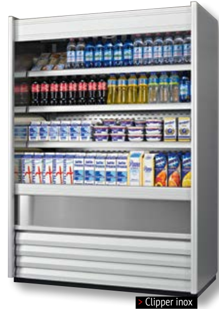
> Clipper inox