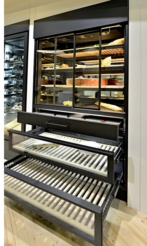
Photos non contractuelles issues du travail de l'agenceur (nous consulter sur options et accessoires)

Eclairage LED parfaitement adapté aux fromages